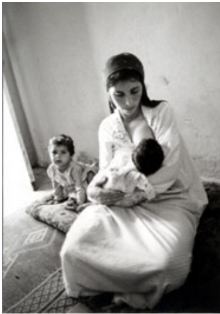
赤ん坊に乳をふくませる母親 (ガザ地区ジャバリア難民キャンプ、撮影・古居みずえ) 『パレスチナ 瓦礫の中の女たち』(岩波書店、2004)より